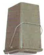
Colore Bianco - Carta e Cartone