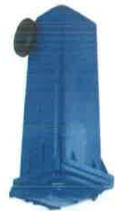
Colore Azzurro - Imballaggi Vetro e Lattine